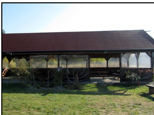
Wiata na terenie rekreacyjnym