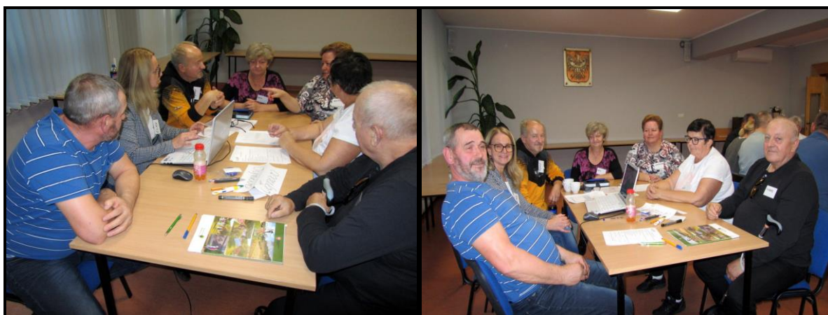
Grupa Odnowy Wsi w czasie warsztatów opracowania Sołeckiej Strategii Rozwoju Sala Sesyjna - Biblioteka Publiczna w Murowanej Goślinie w dniach 25-26.10.2024 r.

SOLECKA STRATEGIA ROZWOJU – wsi WOJNOWO wypracowana przez GOW na warsztatach w ramach programu UMWW - „Wielkopolska Odnowa Wsi 2020+”