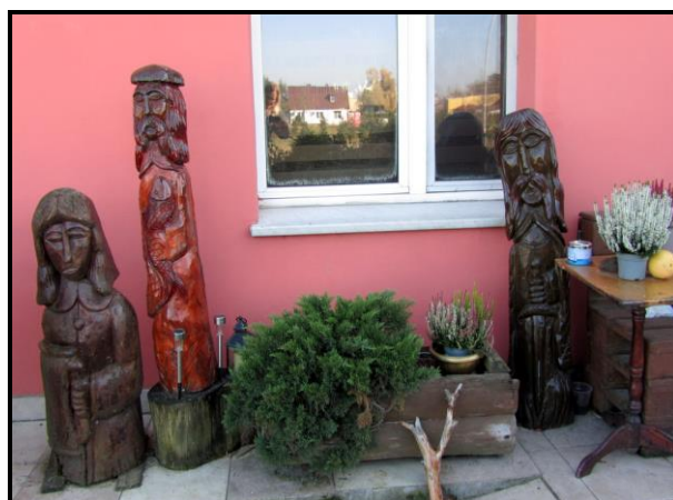
Prace lokalnego rzeźbiarza