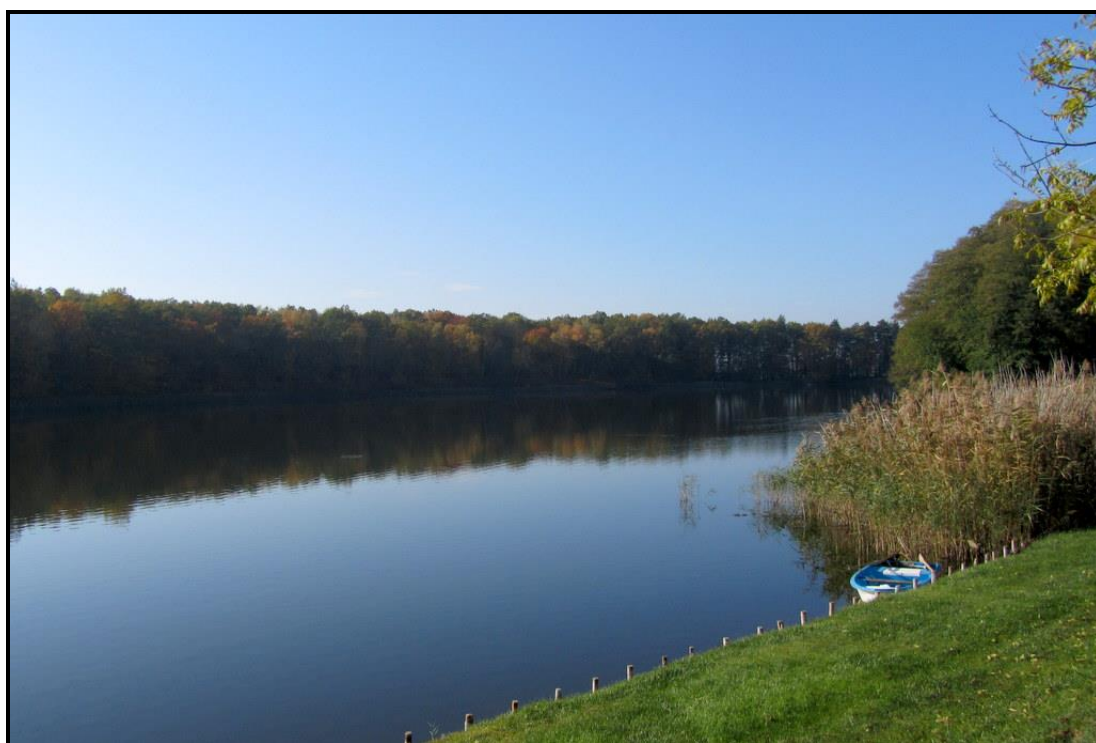
Urokiwe Jezioro Wojnowskie

SOLECKA STRATEGIA ROZWOJU – msi WOJNOWO wypracowana przez GOW na warsztatach w ramach programu UMWW - „Wielkopolska Odnowa Wsi 2020+”