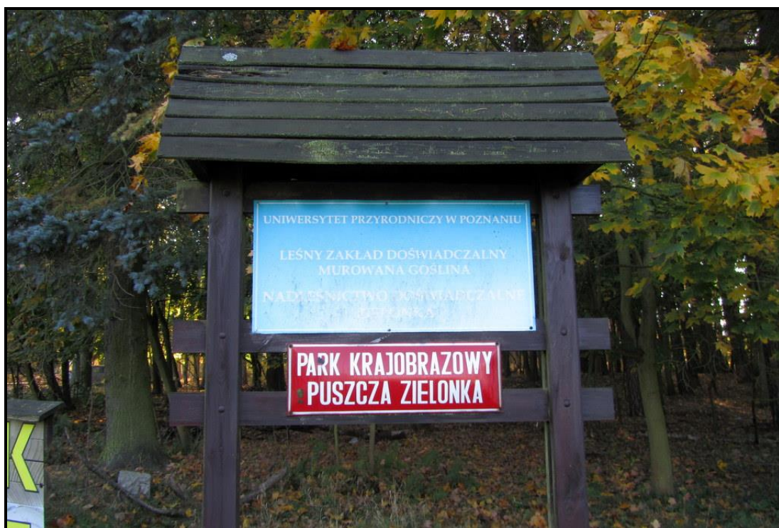
Park Krajobrazowy Puszcza Zielonka

SOŁECKA STRATEGIA ROZWOJU – wsi RAKOWNIA wypracowana przez GOW na warsztatach w ramach programu UMWW - „Wielkopolska Odnowa Wsi 2020+”