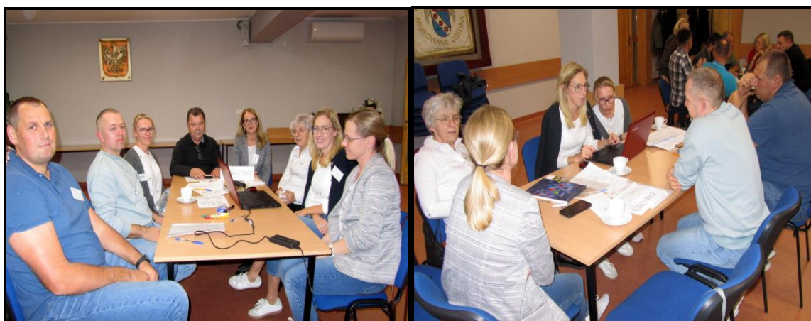
Grupa Odnowy Wsi w czasie warsztatów opracowania Sołeckiej Strategii Rozwoju Sala Sesyjna - Biblioteka Publiczna w Murowanej Goślinie w dniach 25-26.10.2024 r.

SOŁECKA STRATEGIA ROZWOJU – wsi RAKOWNIA wypracowana przez GOW na warsztatach w ramach programu UMWW - „Wielkopolska Odnowa Wsi 2020+”