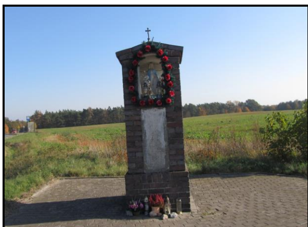
Miejsce kultu religijnego