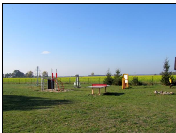
Miejsce sportu i rekreacji