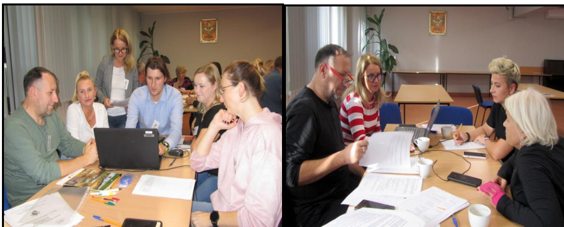
Grupa Odnowy Wsi w czasie warsztatów opracowania Sołeckiej Strategii Rozwoju Sala Sesyjna - Biblioteka Publiczna w Murowanej Goślinie w dniach 25-26.10.2024 r.

SOŁECKA STRATEGIA ROZWOJU – wsi GŁĘBOCKO wypracowana przez GOW na warsztatach w ramach programu UMWW - „Wielkopolska Odnowa Wsi 2020+”