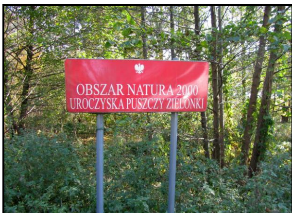
Głębocko – Obszar Natura 2000