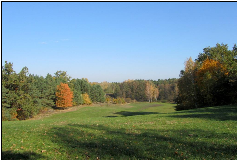
Walory przyrodnicze sołectwa