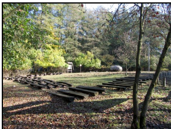
Miejsce integracji i spotkań mieszkańców