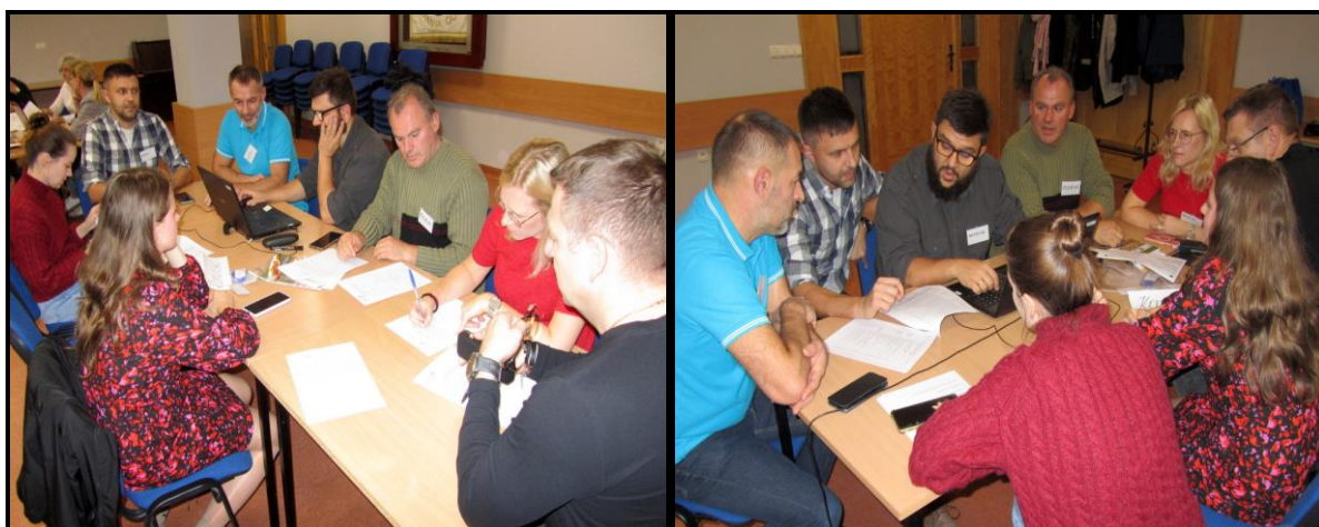
Grupa Odnowy Wsi w czasie warsztatów opracowania Sołeckiej Strategii Rozwoju Sala Sesyjna - Biblioteka Publiczna w Murowanej Goślinie w dniach 25-26.10.2024 r.

SOLECKA STRATEGIA ROZWOJU – KAMIŃSKO wypracowana przez GOW na warsztatach w ramach programu UMWW - „Wielkopolska Odnowa Wsi 2020+”