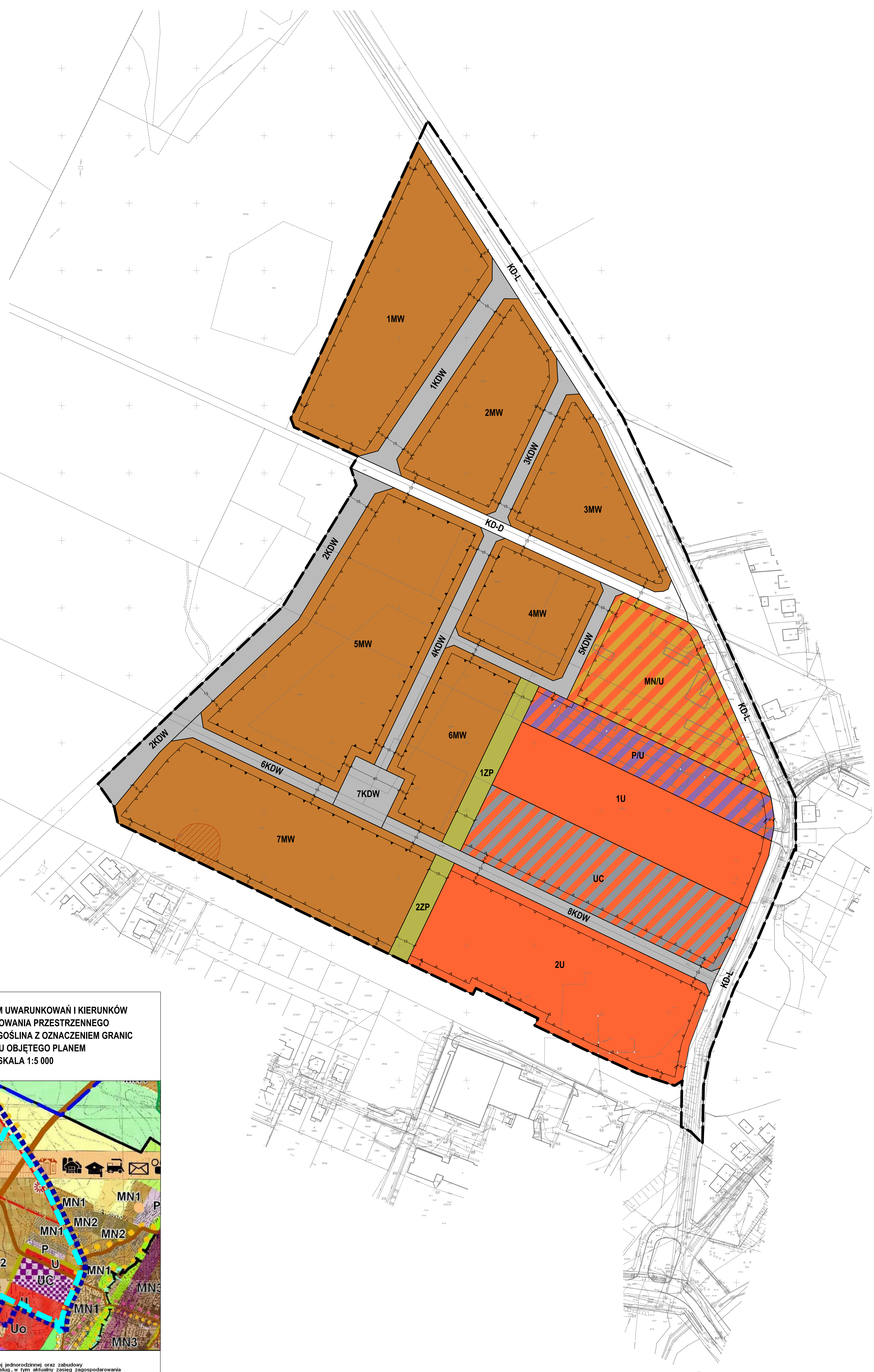
WYRYS ZE STUDIUM UWARUNKOWAŃ I KIERUNKÓW ZAGOSPODAROWANIA PRZESTRZENNEGO GMINY MUROWANA GOŚLIŃNA Z OZNACZENIEM GRANIC OBSZARU OBJĘTEGO PLANEM SKALA 1:5 000